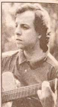
El cantautor nacional se recuperó de una gastroenteritis, que hizo peligrar su concierto de esta noche.

Alberto tiene planificada una serie de presentaciones personales, la mayoría en provincias. Al respecto, el intérprete hace un alcance: "Yo creo que es una buena idea la del sello EMI de acostumar a la gente a ir a los recitales aquí en la capital. En Santiago hay